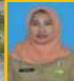
KASI KESEJAHTERAAN SOSIAL TARWIYAH, S.Sos